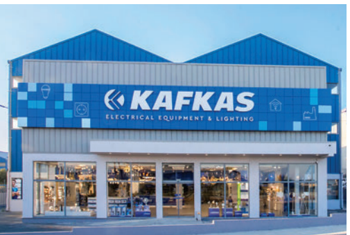
Τον Οκτώβριο τόσο οι εργαζόμενοι όσο και οι πελάτες απόλαυσαν τα οφέλη της «Εθνικής Εβδομάδας Εξυπηρέτησης Πελατών» στα 60 καταστήματα της FEGIME Ελλάδος & Κύπρου, τα οποία είναι όλα πολύ σύγχρονα και φιλόξενα.