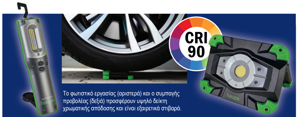
Το φωτιστικό εργασίας (αριστερά) και ο συμπαγής προβολέας (δεξιά) προσφέρουν υψηλό δείκτη χρωματικής απόδοσης και είναι εξαιρετικά στιβαρά.

Τα νέα φώτα LED της Haupa με υψηλό δείκτη χρωματικής απόδοσης εγγυώνται την ασφάλεια στην εργασία.