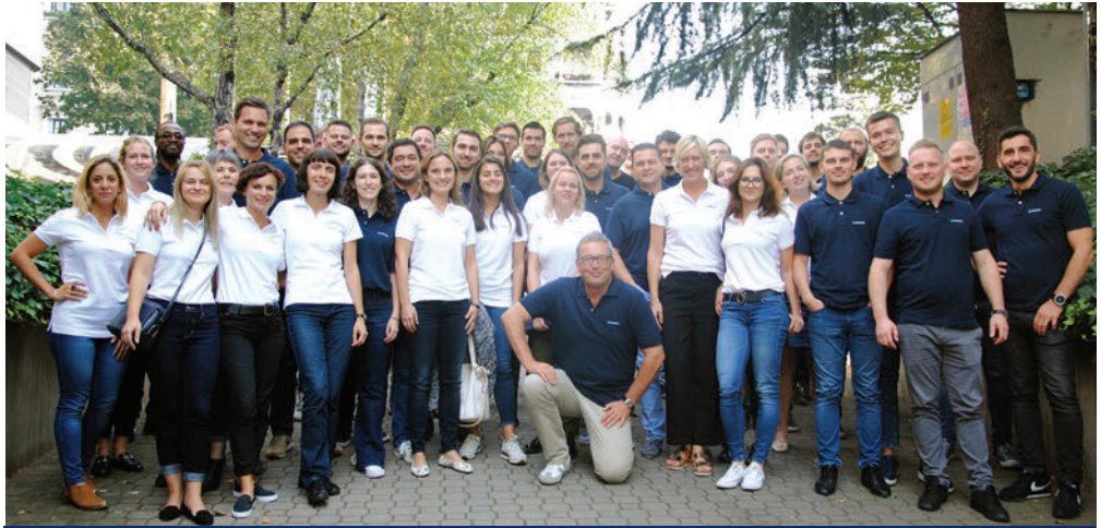
FEGIME Future: οι επιχειρηματίες επόμενη γενιά συνδέονται όλο και περισσότερο.

50 συμμετέχοντες, εξαιρετική θεματολογία και καθηγητές: η FAMP στο Μιλάνο αποτέλεσε ένα εμπνευσμένο και απαιτητικό γεγονός.