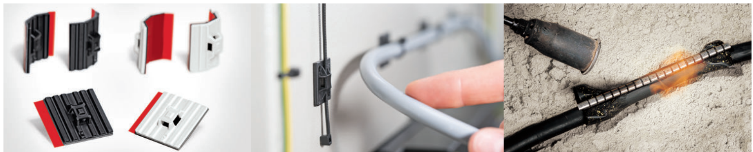
Αριστερά: η βάση FlexTack. Κέντρο: SolidTack - και δεξιά: το κιτ επισκευής καλωδίων RMS.