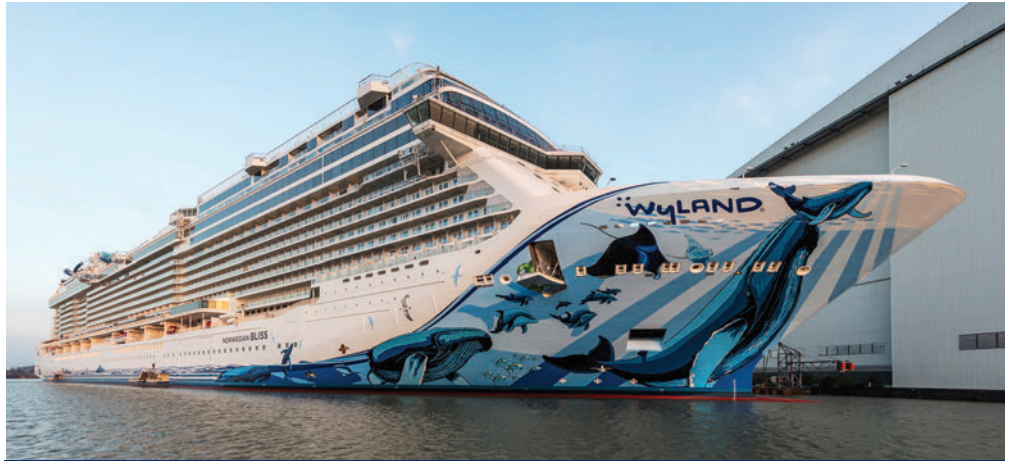
Εξοπλισμένο με εξαρτήματα OBO: το «Norwegian Bliss».

Η OBO Bettermann κατέχει ηγετική θέση στον τομέα της υποστήριξης καλωδίων. Είτε από ανοξειδωτο χάλυβα είτε αλουμίνιο, γαλβανισμένο ή γαλβανισμένο εν θερμώ, τα υψηλής ποιότητας υλικά της OBO κα-