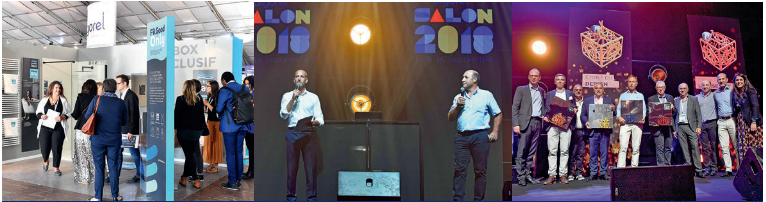
Η τελετή απονομής των βραβείων για το «Etoiles Algorel» (δεξιά) ήταν μια σημαντική στιγμή της μεγάλης εμπορικής έκθεσης στην οποία συμμετείχαν 195 εκθέτες.